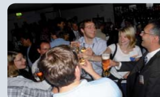
Ehemalige und aktive Mitglieder von SIFE Wuppertal feiern gemeinsam