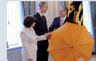
MSfW-Gründer geehrt von Horst Köhler