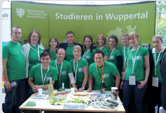
„Regional Table“: Traditionelles Vorstellen von Team und Heimatstadt beim National Cup

Wir bearbeiten seit 2004 gesellschaftsrelevante Projekte innovativ, nachhaltig und erfolgreich, zuletzt unter dem Leitgedanken „Shaping Future“.