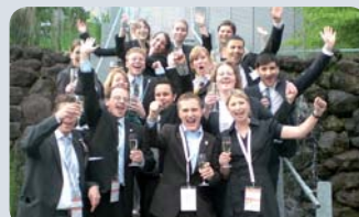
Jubel über den 2. Platz beim NC 2010