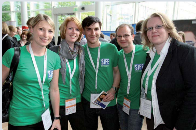
Teamarbeit wird bei SIFE Wuppertal groß geschrieben!